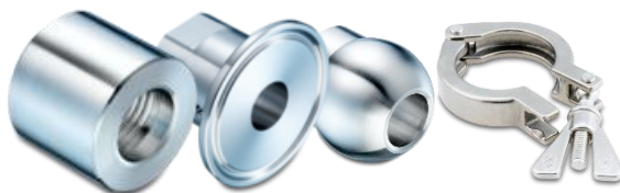
Sveisestusser, overganger, og clamptilkoblinger.