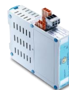
Barrierer for ATEX-installasjoner