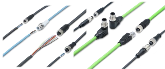
Kabler i mange utførelser med plugg i én eller begge ender.