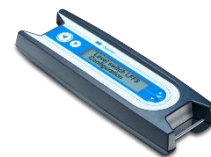
Programmeringsenhet for krevende installasjoner. (90% av installasjonene fungerer i fabrikkoppsett).